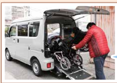
【自動車購入費助成】