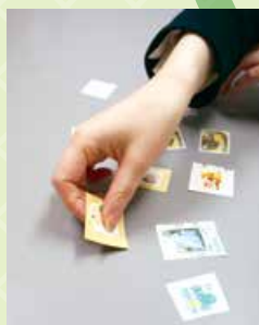
未使用切手は 料金ごとに分けて、 袋に入れて完了!