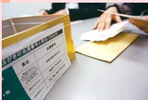
2026年の年賀状で当選したものはBOXへ。 他は切手の値段別にわけ。