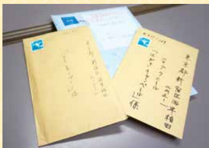
全国から届いた郵送物。 まずは開封。