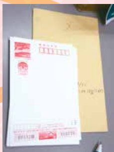
枚数をカウントして 封筒に記入。