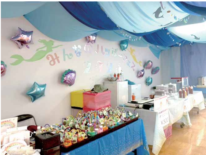
「みんなのハッピーフェス」会場の様子

社協では「福祉まつり」を例年開催しています。内容については、「福祉」という言葉から連想しやすいような地域活動支援センター「いぶき」の作品販売や、社協会員募集のコーナーもあります。それがとどまりません。島外から直送された野菜の販売や、フリーマーケット、飲食のブース、子ども向けのゲームコーナーなど、老若男女の島民が楽しめるような企画にしました。また、当日は「海」をテーマに、社協の建物全体が工夫を凝らした装飾に包まれました。この「福祉まつり」を2025年12月の開催より「みんなのハッ