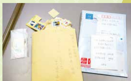
切手でした。使用済みと未使用切手を分け、前者は重さを測る。