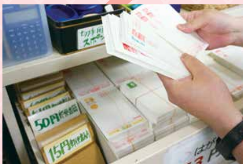
100枚ごとにまとめて収納。