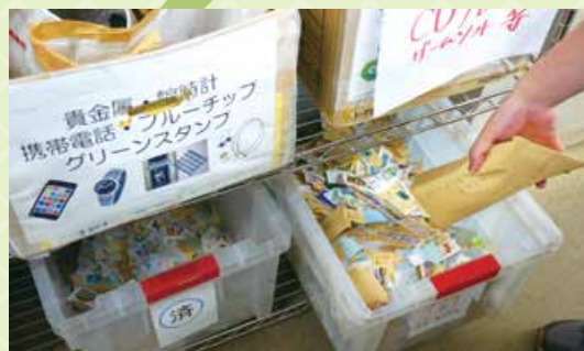
使用済みはこちらへ。