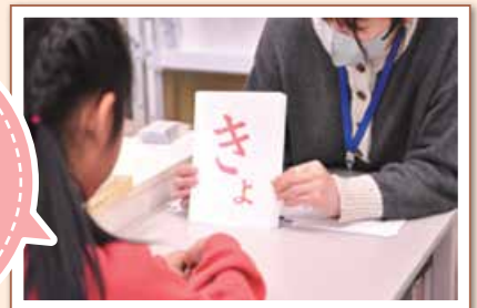
【認定NPO法人取得資金助成】