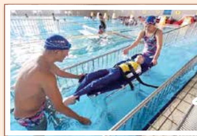
【組織および事業活動の強化資金助成】