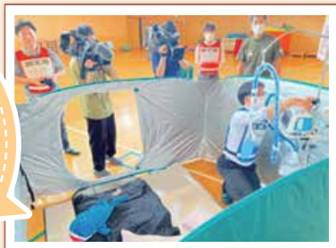
【住民参加型福祉活動資金助成】

重症心身 障害者のための 避難訓練は、 当事者だけでなく 地域住民や 行政との協働！