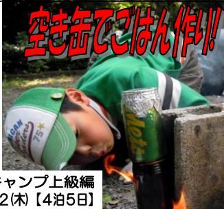
おもしろ村キャンプ上級編 8/18(日)～22(木)【4泊5日】