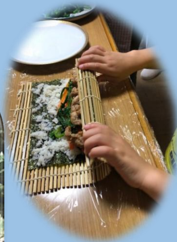
キムパ作りと 韓国文化を学ぶ会