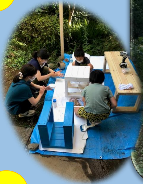
みんなでベンチ作り