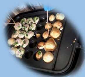
アレルギー対応 たこ焼きパーティー