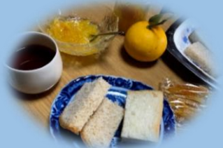
マーマレード作り