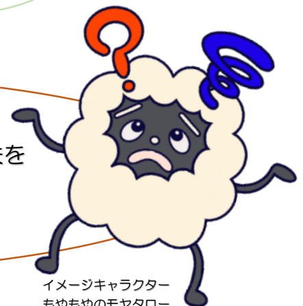
イメージキャラクター もやもやのモヤタロー

高齢者・障害者の事業所や、ボランティアの みなさんなどのご参加お待ちしております！