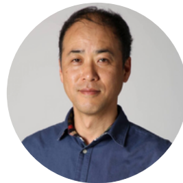
石山恒貴教授 法政大学大学院 政策創造研究科