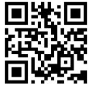
民間相談機関 連絡協議会HP

地域において相談活動を行う民間の機関・団体は多数存在し、その行う領域は多岐に渡っています。しかし、近年の社会経済状況の変動にともない、寄せられる相談内容も多様化・複雑化しつつあります。各々の相談機関だけでは解決できないケースも増えてきており、ほかの機関・団体との連携した取り組みが必要となっています。そこで、都内に所在し、相談活動を行っている民間相談機関・団体を中心に、協力・連携し、学び合い、支え合える場づくりを目的にネットワークとして活動しています。