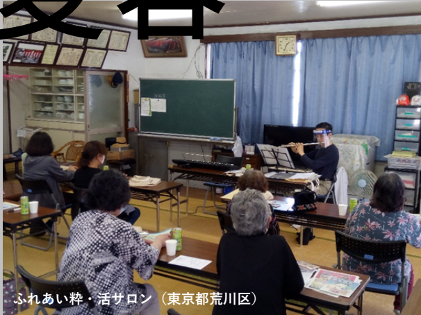
ふれあい粋・活サロン (東京都荒川区)

密集・密接を目指してきた居場所づくり。コロナ禍により「集う」意味が一変しました。住民主体の居場所づくりをエンパワーメントしてきた中間支援組織等に所属する外部支援者は現状をどのように捉えているのでしょうか。コロナ禍で地域交流や居場所づくり、支援の形がどのように変容したのかを支援者の視点からご紹介し、今後のあり方について話し合います。