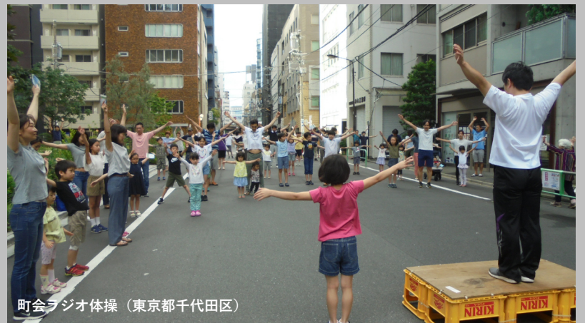
町会ラジオ体操 (東京都千代田区)