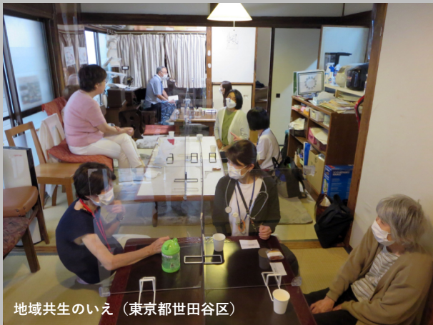
地域共生のいえ (東京都世田谷区)