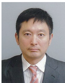
弁護士 森 保道 氏

1990年弁護士登録。特に、女性・子ども・外国人の人権、人権教育に関心が高い。2017年、子どもの権利委員会(国連で採択された「子どもの権利に関する条約」に基づいて設置された委員会)委員に日本人として初めて就任。