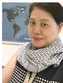
弁護士・国連子どもの権利委員会委員

福井大学子どものこころの発達研究センター発達支援研究部門教授・副センター長、福井大学医学部附属病院子どものこころ診療部長。日本小児科学会専門医・指導医、日本小児神経学会専門医、日本小児精神神経学会認定医、子どものこころ専門医。小児発達学、小児精神神経学、社会融合脳科学が専門。