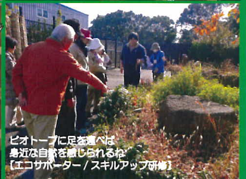
ビオトープに足を運べば 身近な自然を感じられるね 【エコサポーター / スキルアップ研修】