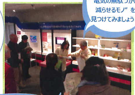
エコライフゲーム

環境に配慮して 生活してみませんか？ “電気の無駄づかいを 減らせるモノ”を 見つけてみましょう！