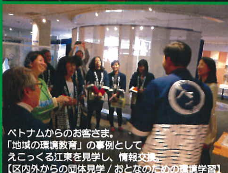
ベトナムからのお客さま。 「地域の環境教育」の事例として えこくる江東を見学し、情報交換。 【区内外からの団体見学 / おとなのための環境学習】