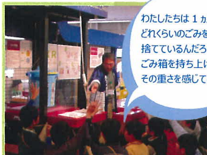
ごみの重さを体験

わたしたちは 1 ヶ月で どれくらいのごみを 捨てているんだろう？ ごみ箱を持ち上げて その重さを感じてみよう！