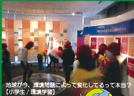
地球が今、環境問題によって変化してるって本当？ 【小学生 / 環境学習】