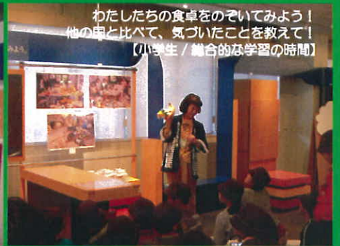
わたしたちの食卓をのぞいてみよう！ 他の国と比べて、気づいたことを教えて！ 【小学生 / 総合的な学習の時間】