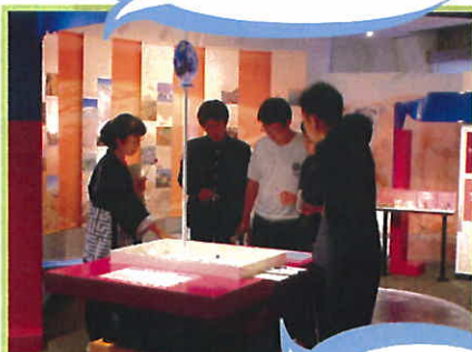
青い地球・赤い地球

もしも地球がサッカーボールの大きさだったら、地球にある水はどれくらいの量だと思う？