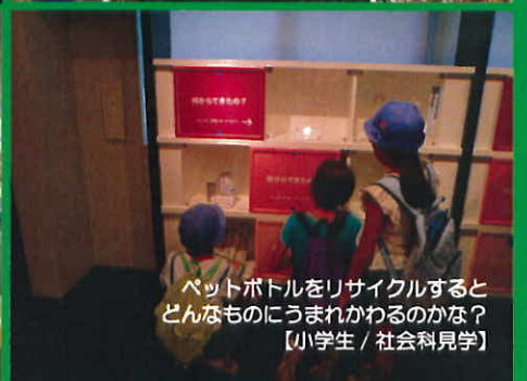
ペットボトルをリサイクルすると どんなものに生まれかわるのかな？ 【小学生 / 社会科見学】