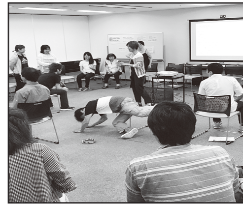
【講師】ケアレクインストラクター (NPO法人日本介護福祉教育研修機構認定)