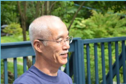
スクールソーシャルワークのパイオニア

わが国にスクールソーシャルワークを導入することを 目的として1983年に、37歳でアメリカに留学。 帰国後の1986年より1998年まで、埼玉県所沢市で初めてのス クールソーシャルワークの実践活動に携わる。 その間、フリースペースの開設やセルフヘルプグループの立 ち上げに関わると同時に、全国各地の不登校親の会とつなが りを持ち、不登校に対する偏見の打破や政策に対する ソーシャルアクションをする。