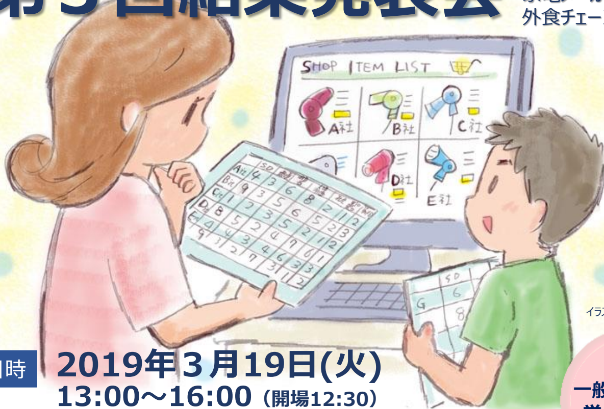
イラスト：みなみななみ