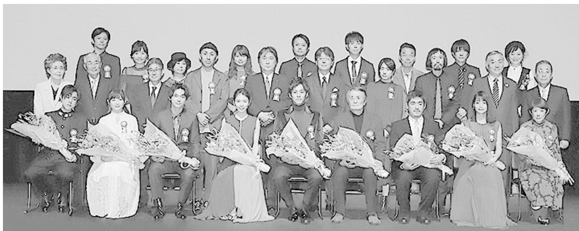
2018年TAMA映画賞受賞式（最優秀男優賞 松坂桃李さん、最優秀女優賞 松岡茉優さんなど多数の受賞者登壇）