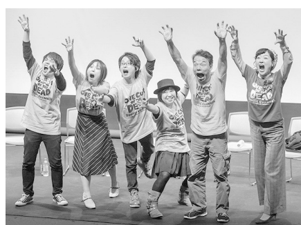
東出昌大『寝ても覚めても』、深川麻衣『パンとバスと2度目のハッコイ』、カメ止めチーム『カメラを止めるな！』