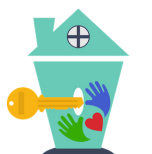
ボランティア団体 Arch(アーチ)

◆ボランティア活動内容◆ 利用者とともに、 カフェ運営・商店街活性化 イベント運営・見守り活動 等