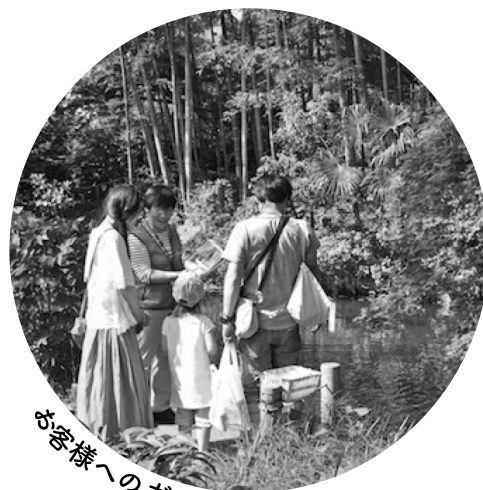
お客様へのガイド