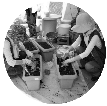
環境整備グループ

実篤や公園の見所について、1~5名位のお客様にガイドします。初めての方でも、養成講座や手引きがあるので安心です。