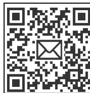
申し込みメールフォーム

開所日時:(火)～(土) 8:30～19:00 ※日・月・祝・第2(木)は休館日