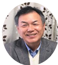
浅井春夫 立教大学名誉教授 “人間と性”教育研究協議会 代表幹事