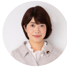
打越さく良 参議院議員 弁護士