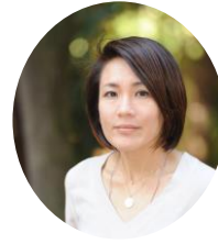
北原みのり ラブピースクラブ代表 作家