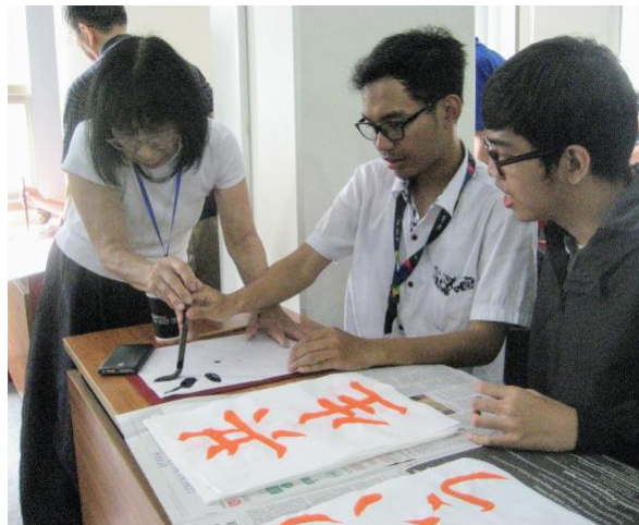
会員による書道教室