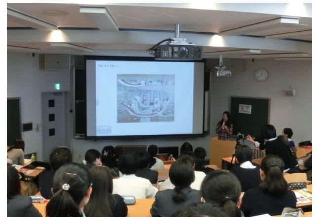
プレゼンテーション大会