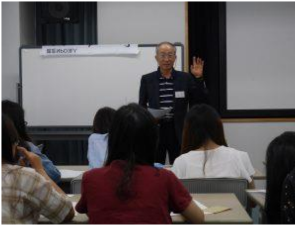
就職支援セミナー

近年、日本での就職を希望するIメイト学生が増えてきましたが、日本企業への就職は未だ容易ではありません。アジ風では就活情報の提供等の支援を行っています。