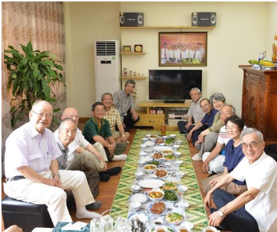
メイト学生のお宅訪問

日本語授業参観やコンテスト、キャンパスツアー、交流会等を行います。会員はパートナーの学生との対面を果たし、交流を深めます。