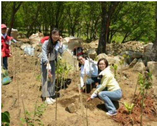
植樹体験ツアー(環境学習)

コロナ禍以前は交流校から毎年30名ほど日本へ留学に来ていました。今後の日本にとって期待すべき人材として支援しています。交流会を開催するほか、2015年度からアジ風奨学基金を開設しました。