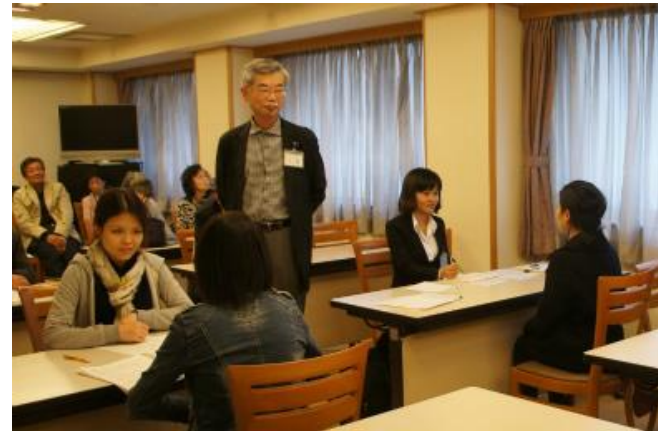
面接のロールプレイ