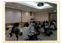
▼中高・学生向けイベントの様子(2018.5)