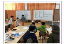
▼小中学生向けWSの様子(2020.1)