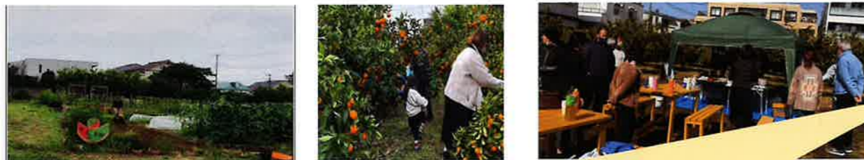
前川氏 のコメント

知的に障害があって、特別支援学校を卒業するとうち成長しないと言われているが、そんなことはない。環境を整えてやり方を工夫すれば知的に障害があっても、成長し続けることができることを、今回明確に示すことができた。家族や支援者、学校の先生や雇用主をはじめ、これを世の中の常識にしていきたい。皆様の身近に知的発達障害のある若者がおられましたら、「人を育てる畑」に通われることで人生の幅が広がられることをお勧めします。