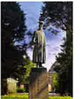
早稲田大学 早稲田キャンパス