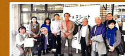
就労継続支援 B 型福祉事業所/横浜