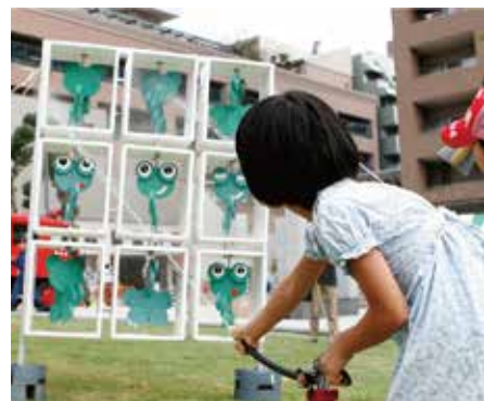
引用元: イザ!カエルキャラバン!公式HP

今回のゲスト・NPO 法人プラス・アーツは、そうした地域の声から親子の参加を促すため、ゲーム形式の防災訓練体験とおもちゃ交換会を組み合わせたプログラム「イザ!カエルキャラバン!」を開発。2013年から、中央区と協働でマンションなどで実施する他、全国の自治体、町会・自治会、企業からオファーを受けています。また、それぞれのニーズや課題に合わせた新たな企画の立案・実施実績も多数。地域から次々に要望を受ける背景には、相手に応じた実施意義や魅力の伝え方、地域の人を担い手として育成する工夫などがありました。それら協働におけるNPO側の工夫や、地域のニーズに応える事業の作り方などを伺います。