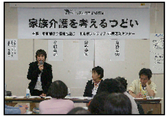
昨年度の家族介護を考えるつどいの様子 (2009.1.31 東京ボランティア・市民活動センターにて)